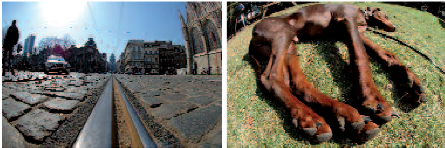
Deze foto's van Wynand van Poortvliet tonen wat er mogelijk is met fisheye als je de cliché's vermijdt.